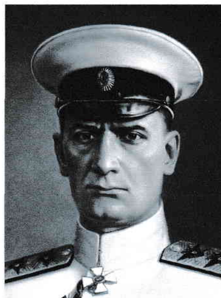
8. Кучак +

Высшая оценка: 8 баллов (по 1 баллу за каждого деятеля).