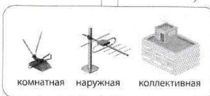
комнатная наружная коллективная

подключите цифровую приставку с DVB-T2*, а антенну** – к телевизору