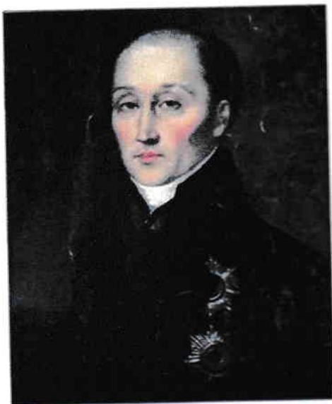
1. Сперанский + +

3. Посмотрите на портреты и укажите, какие деятели на них изображены.