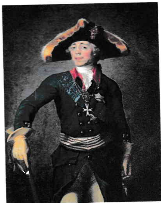
3. Сталин I + +