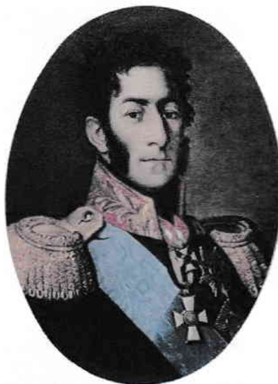
2. Баграмян + +