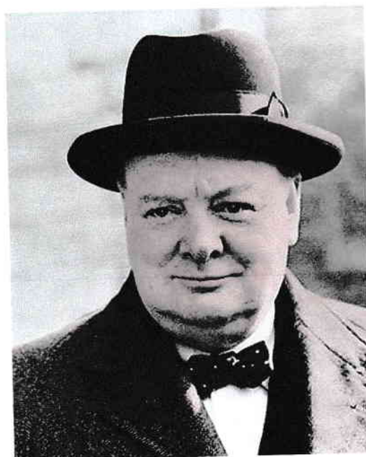
4. Черчилль + +